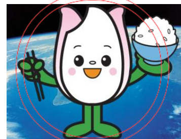
食育・花育推進キャラクター まいかちゃん